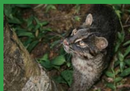
イリオモテヤマネコの保全

西表島に思いを寄せるみなさんのご寄付をお待ちしています。寄付の方法は、裏面をご覧ください。