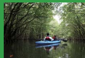
適正な観光管理の実現