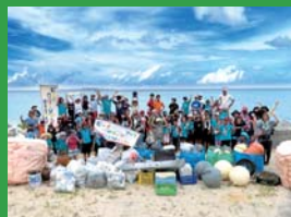
海岸漂着ゴミ対策