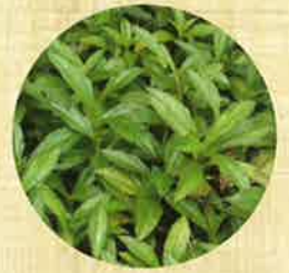
アメリカハマグルマ